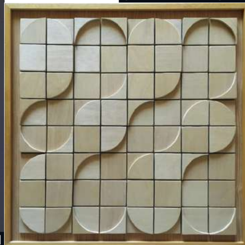
GALERIA RAFAEL ORTIZ